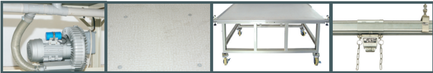
气浮式核心部分，出风大，寿命长